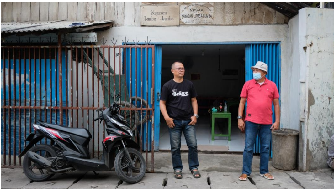
Tampak Luar Yayasan Lumba Lumba.