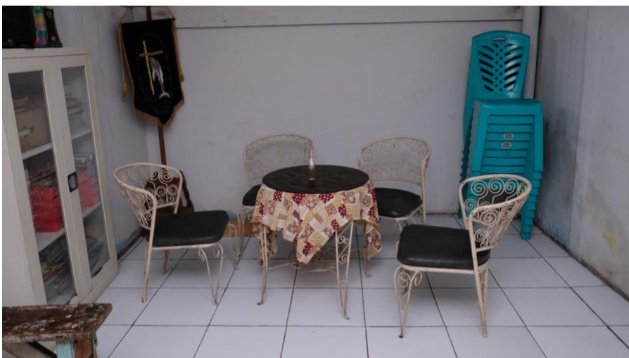
Atas: Kondisi kelas di Yayasan Lumba Lumba. Tengah: Bantuan sembako dari yayasan Kasih Pama. Bawah: Ruang tamu di yayasan.