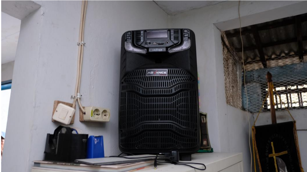
Salah satu kado natal dari YKP berupa 1 unit Speaker Aktif beserta Mic.

Terdapat 2 ruang kelas yang terpisah, ada kipas angin, penerangan kelas masih kurang terang, udara kelas lembab.