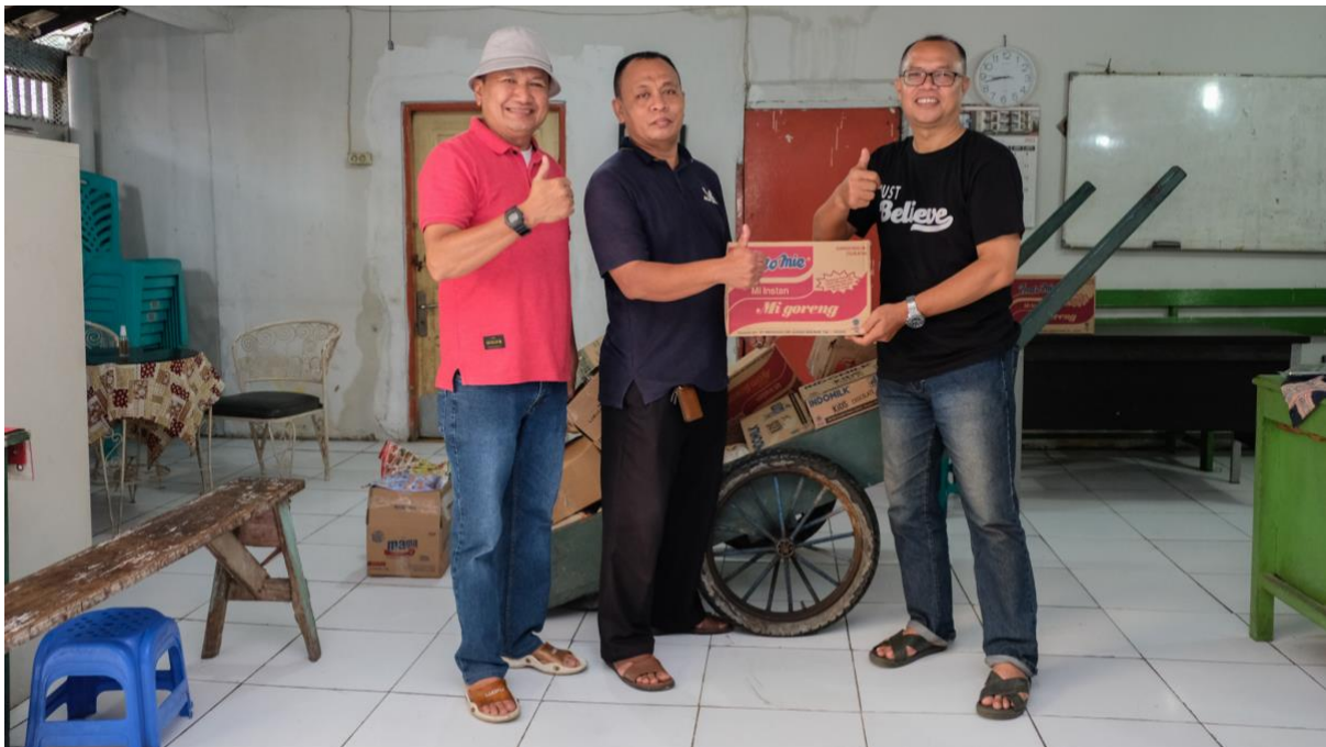
Serah terima bantuan rutin dari Yayasan Kasih Pama kepada Yayasan Sosial Lumba Lumba, 25 Februari 2023.