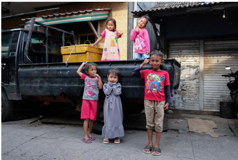
Beberapa anak warga sekitar yang juga bersekolah di Yayasan Sosial Lumba Lumba.

Berdasarkan data terupdate di atas, saat ini di Yayasan Lumba Lumba terdapat 137 anak yang terdaftar sebagai murid, ada 10 orang staff dan 3 orang guru. Kegiatan rutin setiap hari senin sampai dengan hari Jumat yaitu kegiatan belajar-mengajar, dan pada hari Sabtu diadakan kegiatan posyandu.