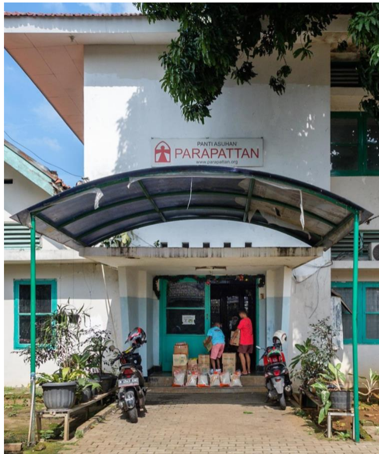
Pintu depan ke area Panti Asuhan Parapattan.

Berdasarkan keterangan yang diberikan oleh Pak Yeremia selaku PIC Panti Asuhan Parapattan mengatakan sekarang jumlah anak ada 26 orang, dengan kegiatan rutin seperti sekolah sudah normal, lalu ada les matematika dan beberapa mata pelajaran yang sifatnya urgent saja, untuk cek kesehatan kami sudah rutin karena salah satu pengurus kami ada yang berprofesi sebagai dokter, apabila ada anak sakit dan harus rawat barulah kami pergi ke Puskesmas.