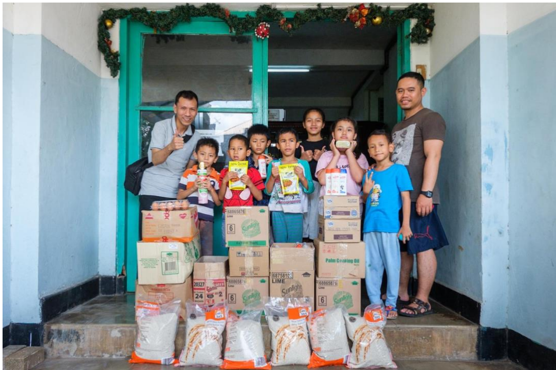
Serah Terima Bantuan Sembako Rutin Yayasan Kasih Pama untuk Panti Asuhan Parapattan Jakarta Timur.

Kepada Bapak dan Ibu terkasih berikut ini disampaikan laporan kegiatan bakti sosial rutin Yayasan Kasih Pama untuk Panti Asuhan Parapattan, Jakarta Timur yang telah selesai dilaksanakan pada hari Minggu, 19 Februari 2023.