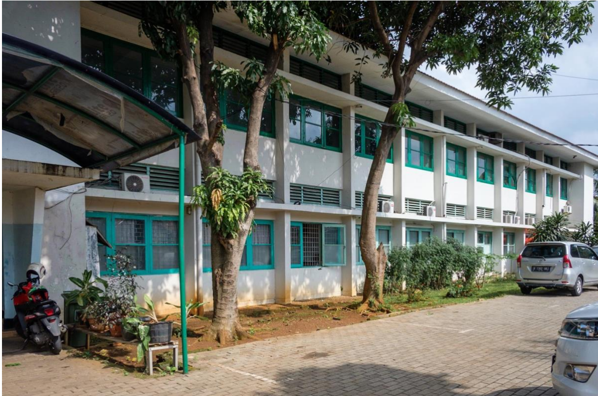
Bangunan bagian depan Pantia, bangunan depan digunakan untuk beberapa ruangan seperti ruang kesehatan, perpustakaan, ruang komputer, ruang pengurus, ruang logistik, dll.

📍 Jl. Rawagelam I No. 9 Kawasan Industri Pulogadung, Jakarta Timur - 13930 ☎ 021- 4602015 ext. 1111 ✉ yayasan.kasih@pamapersada.com