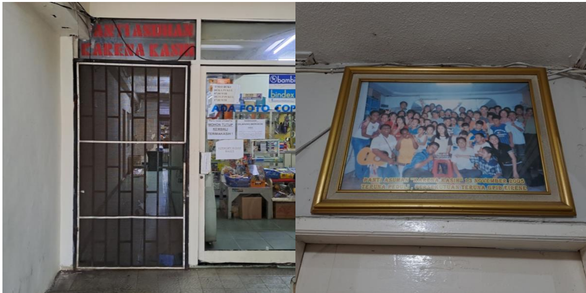
Pintu masuk utama Panti.

Sampai saat ini pihak panti tidak nenerima kunjungan yang menggunakan acara bersama anak-anak untuk menghindari resiko terkena covid, namum panti tetap menerima bantuan dan kunjungan dalam skala kecil saja atau perwakilan tanpa ada acara bersama anak-anak.