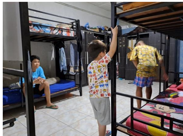
Ruang kamar untuk anak laki-laki.