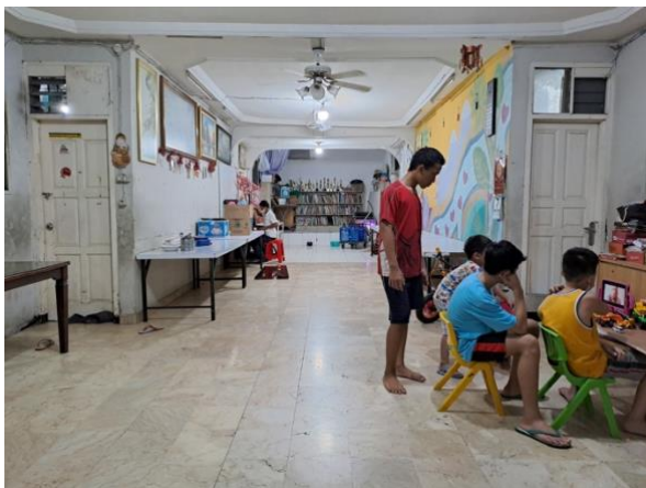
Ruang tengah di lantai 1.

Anak-anak sekolah di dalam area Panti yaitu di lantai 2, dengan mendatangkan guru-guru, layaknya sekolah pada umumnya, sekolah yang ada di panti menyesuaikan standar pemerintah seperti buku-buku LKS, seragam sekolah, seragam olah raga, seragam pramuka hingga sepatu, untuk yang kuliah mereka ambil jurusan teologi.